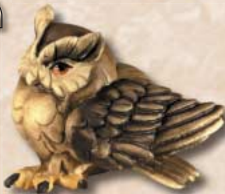
Zwergohreule braun | gufo marr. | eagle-owl brown