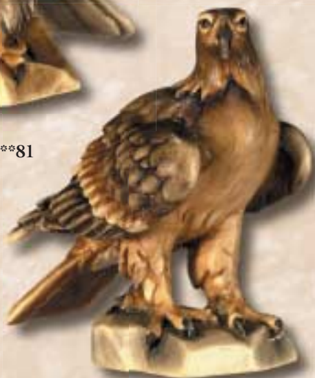
Adler braun | aquila marrone | eagle