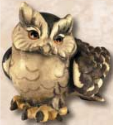
Zwergohreule grau | gufo grigio | eagle-owl grey